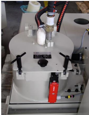
MR 25 dans une installation

centrifugeuse à bol plein pour la séparation de la matière solide du liquide