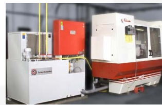
为Studer CNC 提供过滤系统