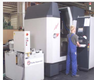
为Haas CNC 提供过滤系统