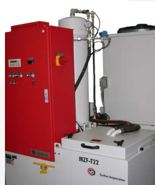
带保安滤芯的T22过滤系统