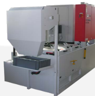
带磁吸预处理的T22过滤系统